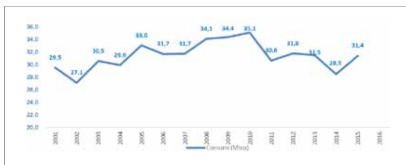
Fig. 2 Impieghi energetici delle famiglie per uso domestico (a) (Mtep) - Anni 2001-2016

liare, aumentando progressivamente da 1.000 euro circa all'anno per una famiglia monocomponente fino ad arrivare a 1.635 euro nei nuclei con 5 o più componenti 4 . La presenza di economie di scala si manifesta in un incremento delle spese non proporzionale rispetto al numero di componenti. Una famiglia composta da 5 membri spende infatti in media annualmente solo il 62% in più rispetto a una famiglia monocomponente. L'andamento dei consumi energetici risulta correlato anche alla situazione socio-economica e culturale della famiglia, mostrando una certa variabilità rispetto sia alla condizione socio-professionale della persona di riferimento sia al suo titolo di studio. A dimostrazione di come le spese energetiche lascino margini di risparmio inferiori ad altri tipi di spesa (elemento, quest'ultimo, che sottolinea la rilevanza dell'approfondimento del tema della povertà energetica), l'incidenza di questa voce sul totale delle spese familiari risulta più elevata nei nuclei che sperimentano un maggior disagio occupazionale ed economico. Nel 2016, il consumo di prodotti energetici incide sul totale della spesa familiare in misura superiore alla media nelle famiglie con persona di